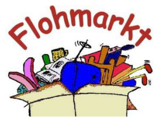
Spielzeug und Bücher