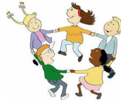
Tanz der Mittags- betreuungskinder