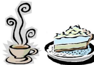
Kaffee und Kuchen