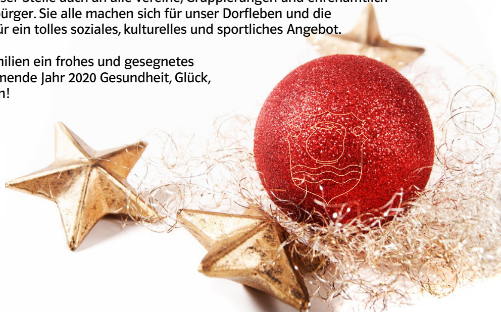
Thorsten Schwab 1. Bürgermeister