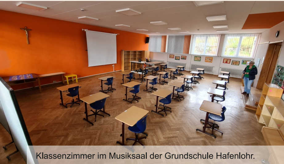
Klassenzimmer im Musiksaal der Grundschule Hafenlohr.

Hafenlohr: Bürgerhaus-Hof Windheim: Bürgerhaus / FFW