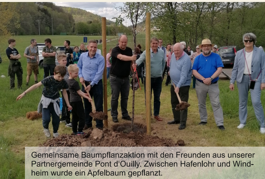
Gemeinsame Baumpflanzaktion mit den Freunden aus unserer Partnergemeinde Pont d'Ouilly. Zwischen Hafenlohr und Windheim wurde ein Apfelbaum gepflanzt.

Weitere Bürgermeister-Sprechstunden sind nach Absprache jederzeit möglich.