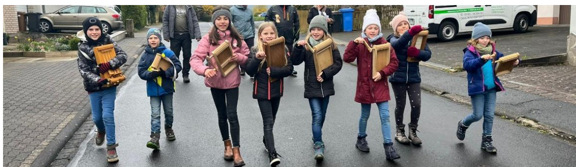
Das Bild wurde beim Leiern 2023 aufgenommen!

Bei Fragen können Sie sich gerne an die Minis Hafenlohr wenden: minis.haf@pfarreiengemeinschaft-st-laurentius.de